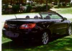
O modelo Sebring da Chrysler, Jeep