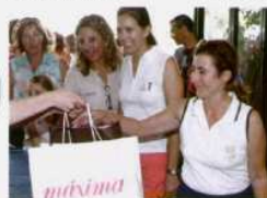
A saída, todas as jogadoras receberam um saco Máxima cheio de "mimos" dos patrocinadores e prometeram voltar em 2010