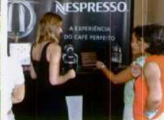
A Nespresso deu a provar os seus novos aromas